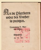
『牧師諸氏へ、高利に反対して』