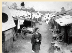
バラック禮日日比谷