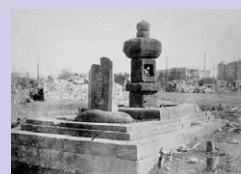
地震で世に出た平将門の塚 大蔵省内