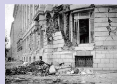
郵船ビルディング