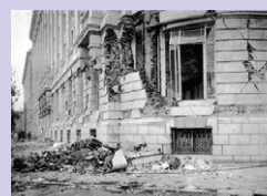
郵船ビルディング